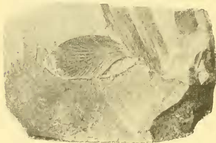
Fig. 1. — Sysciophlebia reticulata F. Meunier (cliché de M. Verheyen d'Anvers).

Sysciophlebia reticulata , nov. sp. — L'élytre de ce nomoneure a 23 mill. de longueur et 10 mill. de largeur. La médiastine (sous-costale) n'atteint pas le milieu du bord costal et comprend sept ner-